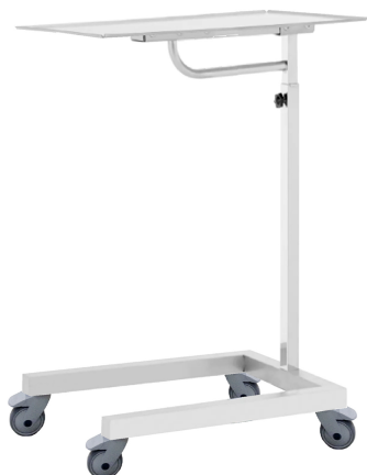
TABLE DE MAYO AMAGNÉTIQUE MOBILE NMMIM305